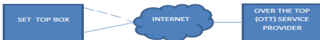
Gambar 1 : Contoh Konfigurasi Sistem Set Top Box - OTT