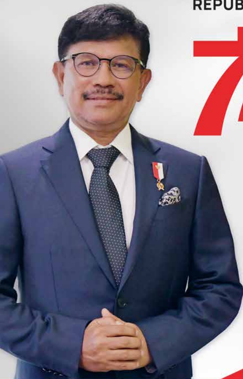
Johnny G. Plate, Menteri Komunikasi dan Informatika